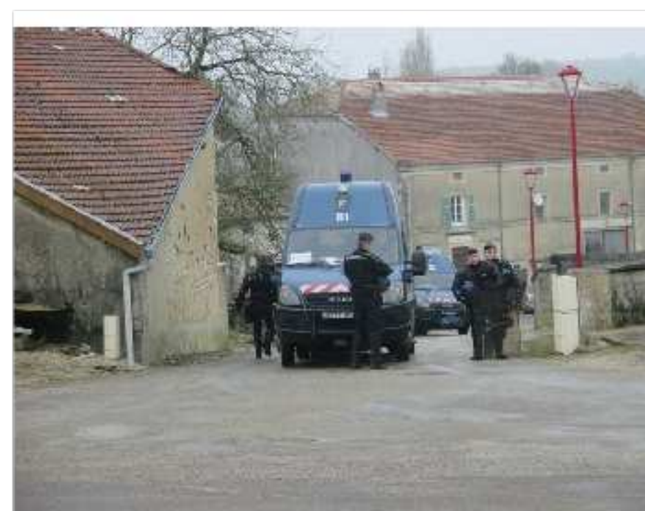
Gendarmes dans Mandres-en-Barrois, à côté de Bure, le 2 mars 2018.

C'est un rapport de 37 pages annexé au dossier d'instruction – qui en compte déjà 15 000 – ouvert en juillet 2017 sur les opposants au projet d'enfouissement des déchets radioactifs (Cigéo) à Bure,