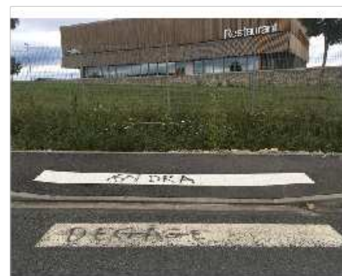
Figure 1: L'hôtel-restaurant Le Bindeuil, le 17 juillet 2017 (JL).

Au Bindeuil, le petit groupe brise des vitres de l'établissement, renverse des chaises sur la terrasse et pénètre dans le bâtiment, alors que des clients et du personnel y dorment. Des verres et des bouteilles d'alcool sont brisés. Des hydrocarbures sont aspergés près de l'ascenseur et du comptoir, provoquant deux débuts d'incendie. Le petit groupe ressort au bout de cinq minutes. Le chef cuisinier du Bindeuil se précipite et éteint les flammes. Personne n'est blessé. Sur les 12