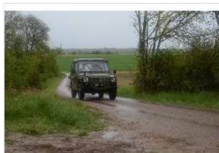
Patrouille de gendarmes autour de Bure, en mai 2019.

La justice envahit leur intimité la plus physique : trois mis en examen refusent le prélèvement de leur ADN ? Leurs sous-vêtements sont saisis pour en extraire leur empreinte génétique. Un caleçon, des culottes et des serviettes hygiéniques sont envoyés aux experts. Sur les photos versées au dossier de l'instruction, un cercle entoure « les traces brunâtres » retrouvées sur le sous-vêtement pour désigner la source de l'ADN prélevé.