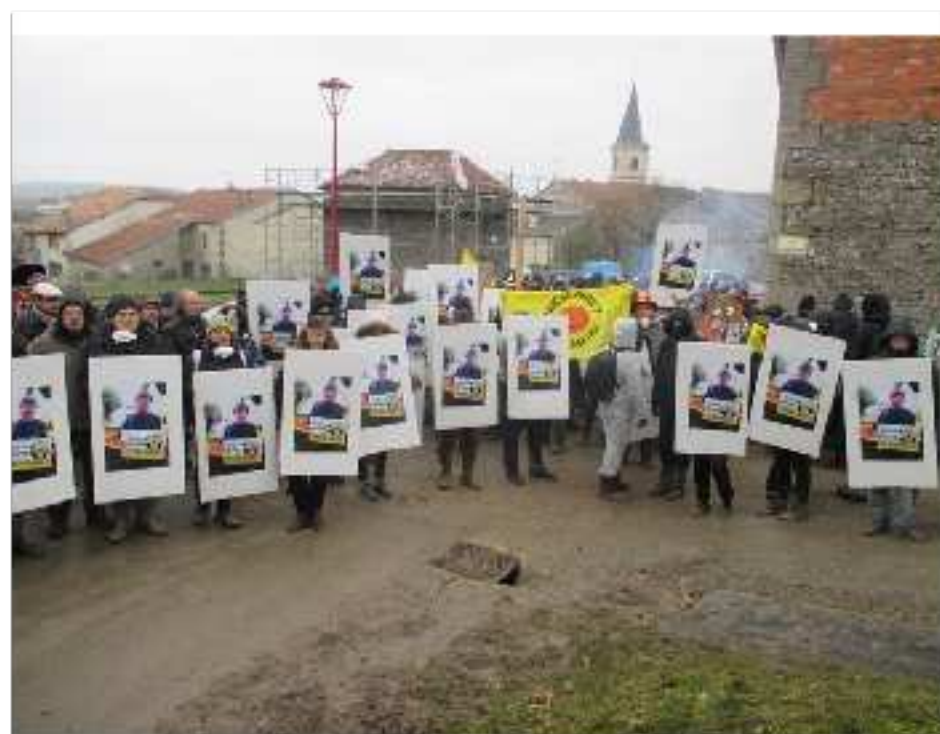
Rassemblement à Mandres-en-Barrois, le 2 mars 2018, pendant laquelle les identités téléphoniques des manifestants sont captées par IMSI catcher.

Pourtant, le « périphérique » fait l'objet d'une attention particulière de la part du procureur de Bar-le-Duc. Le 12 octobre 2017, après l'ouverture de l'information judiciaire, il transmet des coordonnées téléphoniques collectées dans le cadre de la procédure Bure à la Direction générale de la gendarmerie. Une cellule de coordination nationale intitulée « CNC-LEX » a été mise en place, « au regard de la survenance de divers faits sur le territoire », comme le résume le chef de la cellule Bure.