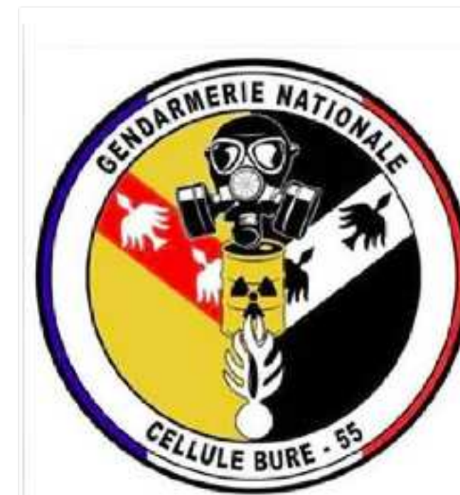
Écusson de "la cellule Bure" des gendarmes enquêtant sur le mouvement anti-Cigéo.

Lors de ces opérations de terrain, d'autres coûts que nous n'avons pas pu objectivement évaluer doivent être pris en compte, comme les transports en groupe des gendarmes et les rotations d'hélicoptères qui accompagnent les perquisitions. De la même manière, nous n'avons pas comptabilisé l'utilisation, dans cette instruction, du logiciel Anacrim, des valises-espionnes Imsi Catchers et du Centre technique d'assistance ( lire notre premier article ). Ces trois services propres à la gendarmerie ne sont pas l'objet d'échanges monétaires mais leur utilisation témoigne cependant de l'importance donnée à cette