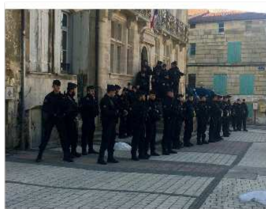
Gendarmes devant le tribunal de Bar-le-Duc, lors du jugement de cinq militants anti-Cigéo, le 5 février 2019.