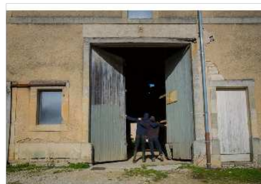
En novembre 2017, une maison des opposants à Mandres, non loin de Bure, qui a aussi été perquisitionnée

« Inévitablement » donc, à Bure et dans les villages environnants, la vie quotidienne de dizaines de personnes est scrutée dans ses moindres détails. Les gendarmes interrogent les responsables des grandes surfaces environnantes pour savoir « dans quels commerces les opposants se fournissent ». Ils questionnent aussi les habitants « aux fins de déterminer précisément les habitudes et lieux de vie des opposants au projet Cigéo les plus radicaux ». Un pharmacien reçoit une réquisition pour fournir l'ordonnance de clients ayant acheté du sérum physiologique. La Maison de la résistance, foyer du mouvement, est placée sur écoute téléphonique.