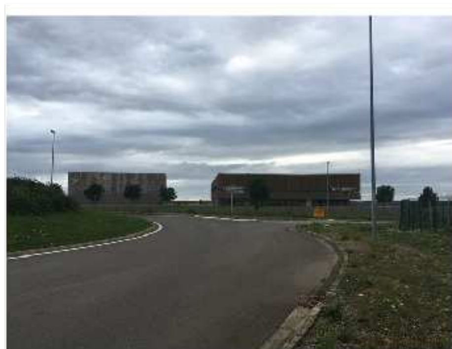
L'hôtel-restaurant Le Bindeuil, en face des archives d'EDF, sur le rond-point qui mène au laboratoire de l'Andra travaillant sur Cigéo, le 17 juillet 2017. (JL)

Rappel des faits : le 21 juin 2017, peu avant 7 heures du matin, plusieurs individus pénètrent à l'intérieur de l'hôtel-restaurant Le Bindeuil, à Bure, dans la Meuse. Le lieu est réputé accueillir des personnels de l'Agence nationale pour la gestion des déchets radioactifs (Andra). Depuis 1998, la lutte secoue ce village lorrain où l'État a décidé d'installer un laboratoire d'enfouissement des déchets radioactifs en couche géologique profonde (appelé Cigéo). Le contexte politique est tendu : un groupe d'opposants s'est installé dans ce qu'ils ont baptisé « la maison de la résistance à la poubelle nucléaire » au cœur du village ; d'autres opposants occupent depuis juin 2016 un bois communal convoité par l'Andra.