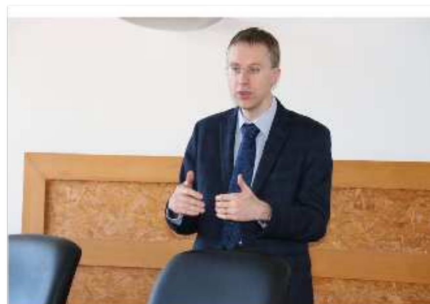
Olivier Glady, procureur de la République de Bar-le-Duc.

Dans un arrêt du 6 décembre 2012, la Cour européenne des droits de l'homme (CEDH) rappelait l'article 8 de la Convention européenne des droits de l'homme sur « la