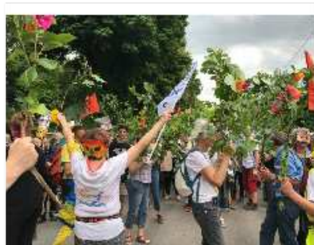
Manifestation anti-Cigéo à Bar-le-Duc, le 16 juin 2018.