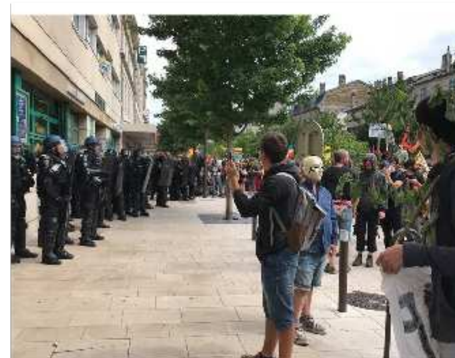
Manifestation anti-Cigéo à Bar-le-Duc, le 16 juin 2018. (JL).

Lors des interventions sur le terrain, le nombre de gendarmes mobilisés grimpe exponentiellement. Environ 150 militaires lors de la vague de perquisitions de juin 2018 concernant quatorze lieux, avec une centaine d'entre eux rien que pour la perquisition de la Maison de la résistance, selon les militants. Les nombreuses personnes interpellées ce jour-là ont été interrogées par une trentaine de gendarmes, d'après leur estimation.